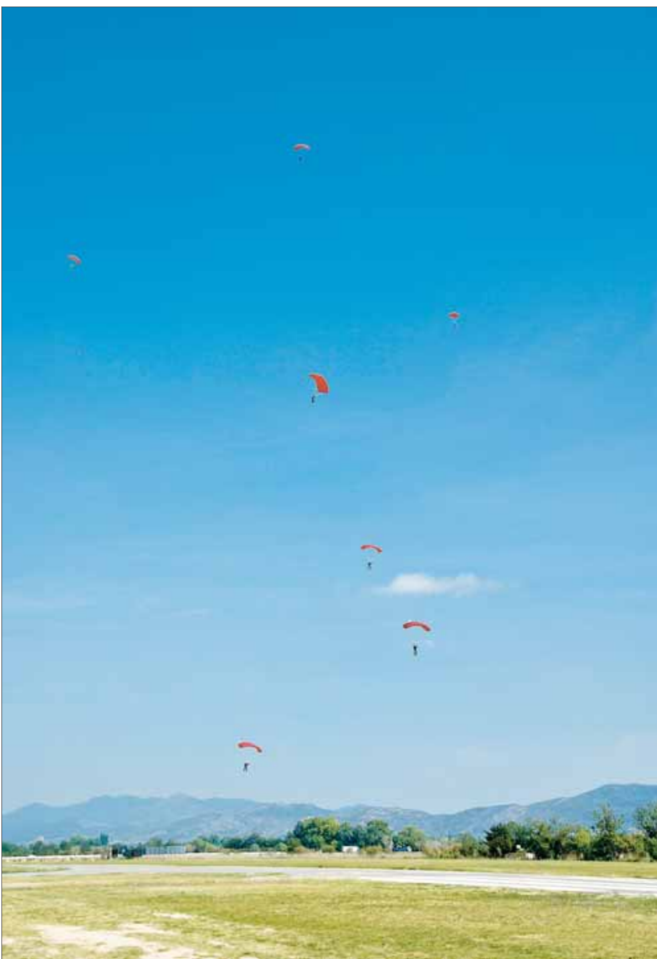
HØJT OPPE. Faldskærmenes spragtede farver sætter kulørte prikker på himlen over det nordlige Spanien.

www Læs mere: www.skydiveempuriabrava.com www.dfu.dk